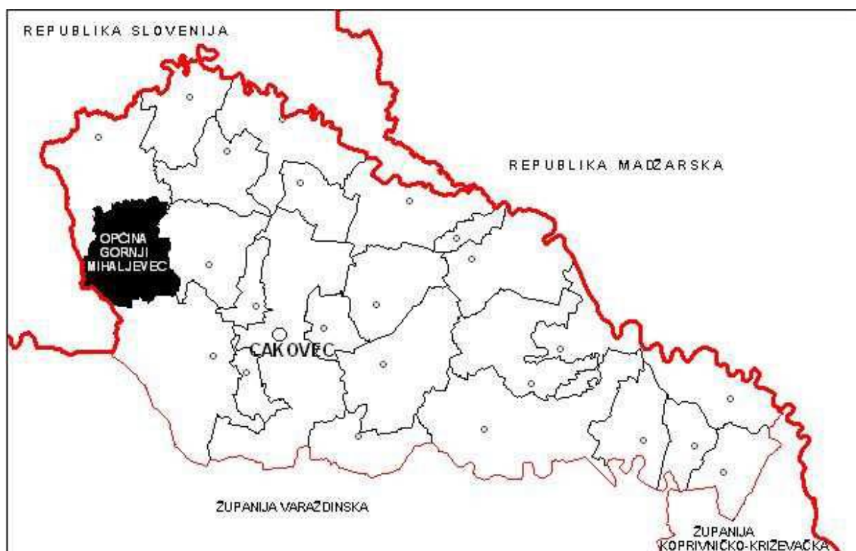
Slika 2. Položaj općine Gornji Mihaljevec unutar Međimurske županije

Taj je prostor, u gospodarskom smislu, desetljećima uvelike bio orijentiran na susjednu Sloveniju – od prometa robe, zaposlenja do obrazovanja i zadovoljenja ostalih potreba građana. Prema ocjeni krajobraznih vrijednosti prostora Županije, područje Gornjeg Međimurja ima karakter osobito vrijednog predjela, kojem u cijelosti pripada i područje općine Gornji Mihaljevec.