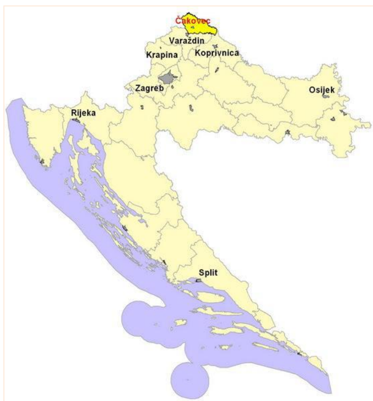
Slika 1. Geoprometni položaj Međimurske županije

Međimurska županija smjestila se na krajnjem sjeveru Republike Hrvatske, između Drave i Mure. Najgušće je naseljena, ali i površinom od 730 km 2 najmanja županija u Republici Hrvatskoj. Prema Popisu stanovništva iz 2011. godine, županija ima 113.804 stanovnika. Graniči sa Varaždinskom i Koprivničko-križevačkom županijom te sa dvije članice Europske unije, Slovenijom i Mađarskom. Ovakav prometni položaj s jedne strane predstavlja prednost (blizina europskog tržišta), a s druge strane i nedostatak, s obzirom na postojanje šengenskog režima na granicama sa susjednim zemljama. Može se dakle konstatirati da područje cijele županije pa tako i Općine Gornji Mihaljevec posjeduje povoljan tranzitni geoprometni i geopolitički položaj, a da je s druge strane to tipično pogranično područje koje karakterizira postojanje državne granice kao fizičke prepreke u ukupnom prirodnom radijusu kretanja (Sl. 1.). Čakovec je administrativno, gospodarsko, prometno i kulturno središte Međimurske županije. Prema NUTS kategoriji, Međimurska županija pripada Kontinentalnoj Hrvatskoj. Čini je 3 grada (Čakovec, Prelog i Mursko Središće), 22 općine i 131 naselje.