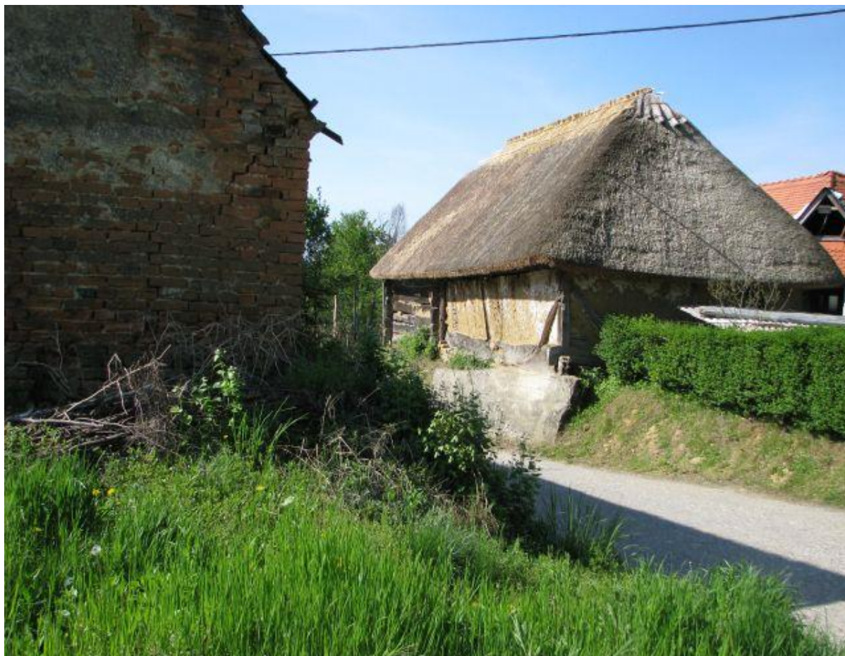
Slika 3. Tradicijska arhitektura Općine Gornji Mihaljevec